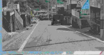
c:カーブ高低差で擦る可能性あり